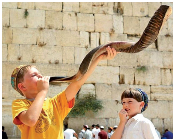
חודש אלול קורא לכל יהודי לעצור ולהתעורר

האם אדם בן ארבעים, חמישים או שישים יכול להשתנות? יש לו המעלות שלו והחולשות שלו ולכאורה כזה יישאר עד יומו האחרון